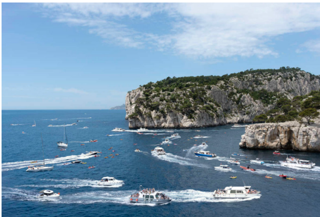
Les calanques de Marseille.

ans plus tard, elle vient d'être classée numéro deux des lieux 'secrets' à découvrir autour de Marseille! »