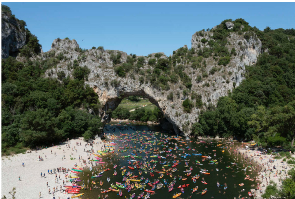
Le pont d'Arc, dans les gorges de l'Ardèche.

L'appli contribue à l'explosion de ce tourisme de masse extrême qui abîme les sites naturels. La photographe Natacha de Mahieu a illustré ce fléau qui touche les paysages « instagrammables », des gorges de l'Ardèche jusqu'au désert des Bardenas, en Espagne.