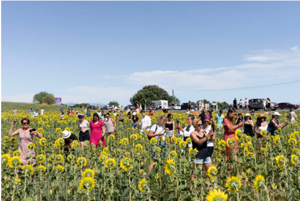
Le plateau de Valensole, dans les Alpes-de-Haute-Provence, juillet 2021.

Calanques, gorges du Verdon ou de l'Ardèche : en France, première destination touristique mondiale (90 millions de visiteurs internationaux en 2019), de plus en plus de sites sont malades de « surtourisme » - autrement dit de surfréquentation, stade ultime du tourisme de masse. Parmi les victimes de ce fléau 2.0, les paysages « instagrammables » se retrouvent en première ligne. Sur les réseaux sociaux, les internautes cherchent en effet à publier l'image au décor enchanteur, celle qui va remporter l'adhésion et les « like ». Or, dans la vraie vie, l'arbre au tronc courbe et bucolique, la vue idyllique sur un champ vallonné attirent une foule bien réelle en quête du même cadrage, du même point de vue. Un mimétisme qui questionne Natacha de Mahieu : « Dans le désert des Bardenas, en Espagne, le rocher photographié est toujours le même, sous le même angle... Sur le plateau de Valensole, c'est en général le premier champ de lavande. Vu de haut en drone, on dirait même un parking. Mais quelques kilomètres plus loin, la campagne est déserte. »