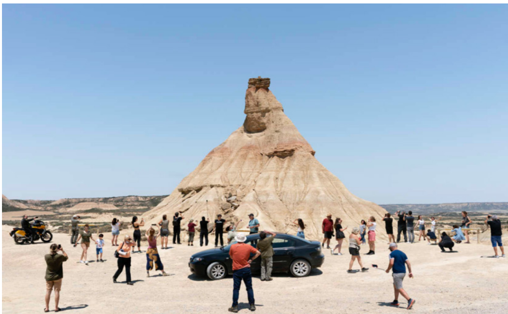
Le désert des Bardenas, en Espagne.